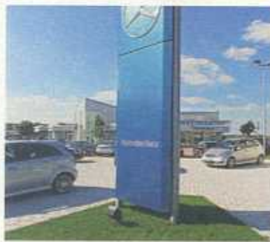
Volle Punktzahl: Für dieses Mercedes-Autohaus im bayerischen Königsbrunn

Zur Inspektion gegeben wurden Mercedes A- und B-Klasse, Opel Astra, Renault Mégane, Toyota Corolla sowie VW Golf. Bei allen war jeweils eine große Durchsicht fällig. Um die Ergebnisse verschiedener Betriebe miteinander vergleichbar zu machen, wurden von den Werkstatt-Experten des ADAC jeweils fünf identische Fehler eingebaut und deren Behebung anschlie-