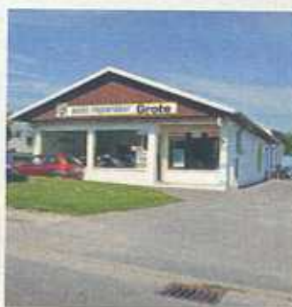
Die beste A.T.U.-Werkstatt im Test (I.) war der Betrieb in Kempen bei Duisburg. Auch der Meisterhaft-Betrieb im niedersächsischen Duingen lieferte gute Arbeit